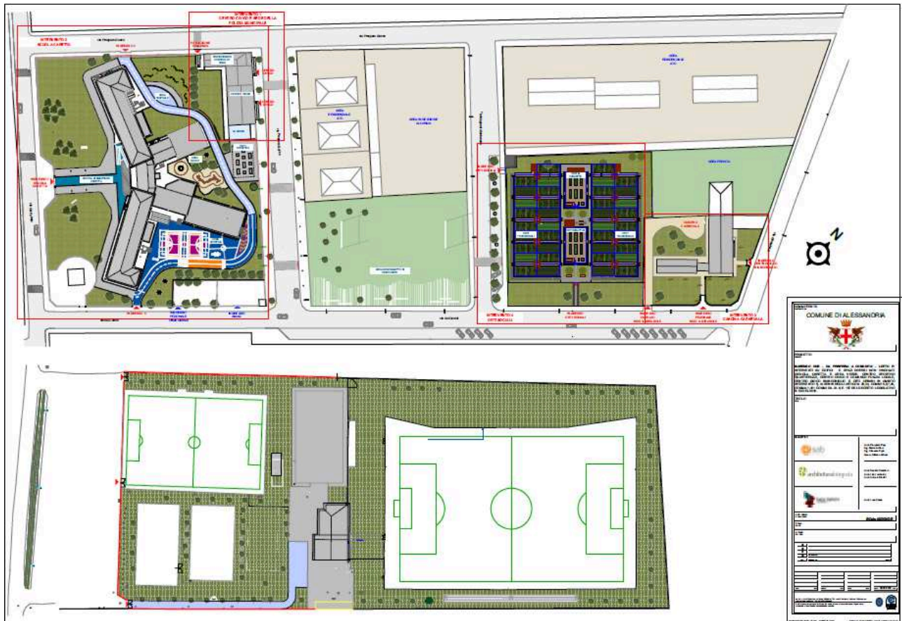
Estratto - Stralcio MASTERPLAN Progetto Definitivo