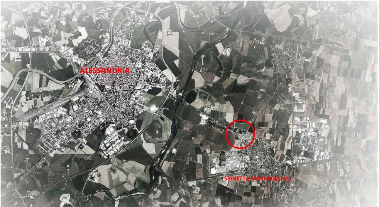
Estratto - Aerofoto