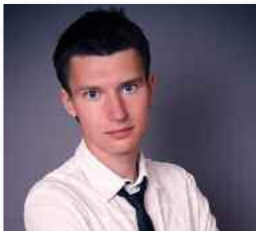
VLADISLAV FEDOROV (Russia)