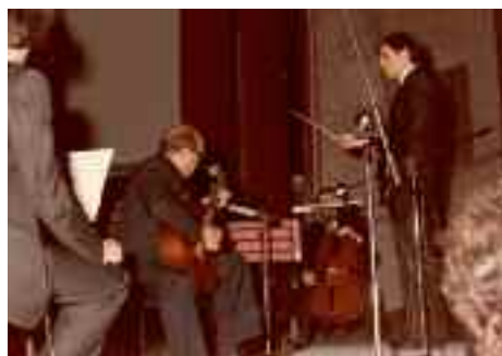
Daniele Gatti dirige la finale nel 1985