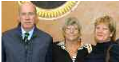
Il Direttivo The Board

A completamento della settimana chitarristica viene anche organizzato in Conservatorio un Convegno internazionale che richiama i più importanti editori, espositori, relatori e pubblico confermando Alessandria come la vera capitale della chitarra nel mondo.